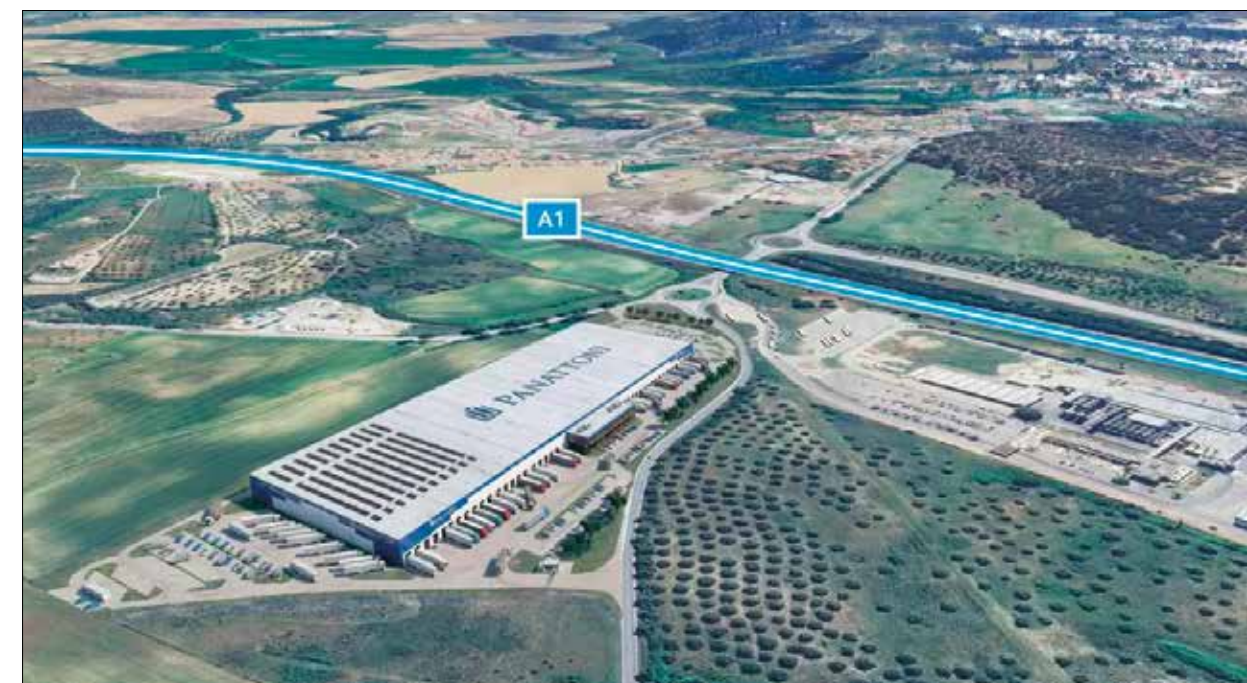
Panattoni Park Santarém

taco 2,5 milhões de euros para a requalificação das muralhas de Santarém, 937.000 euros para a implementação dos bairros digitais, 338.000 euros para o Projeto da Insectera, 300.000 euros para o Radar Social, entre muitos outros. Estes projetos representam um investimento significativo, com os investimentos privados ultrapassam no Concelho 61,9 milhões de euros.