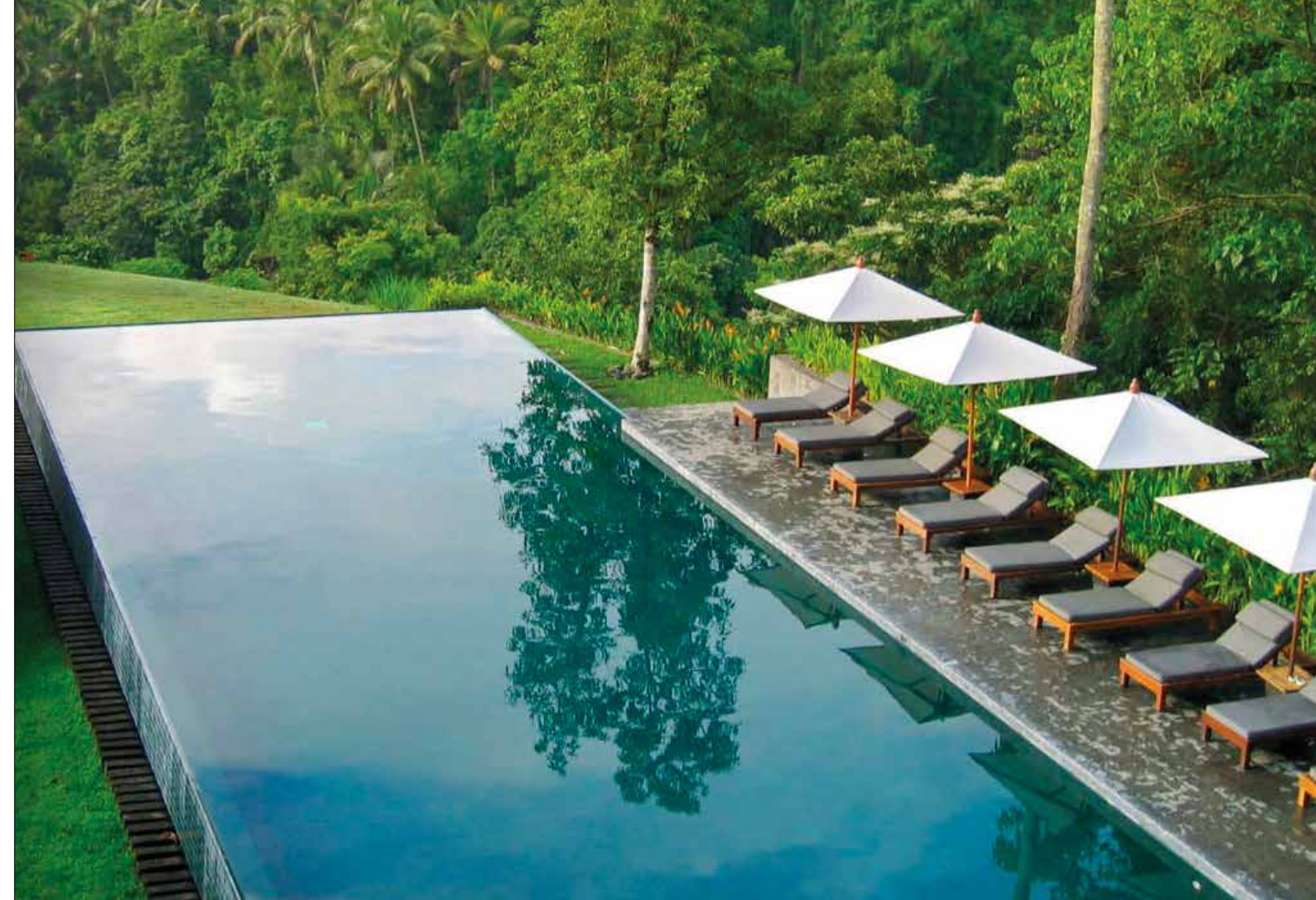
Eco-Resort na Guiné-Bissau