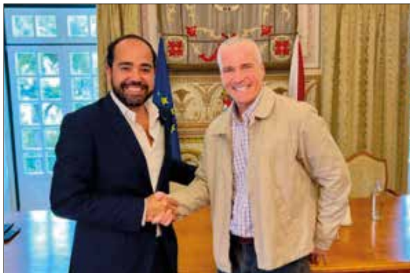
Presidente da Câmara de Santarém com Administrador da empresa 52 Fresh

Como é que Santarém se vai posicionar face ao futuro Aeroporto de Lisboa em Benavente?