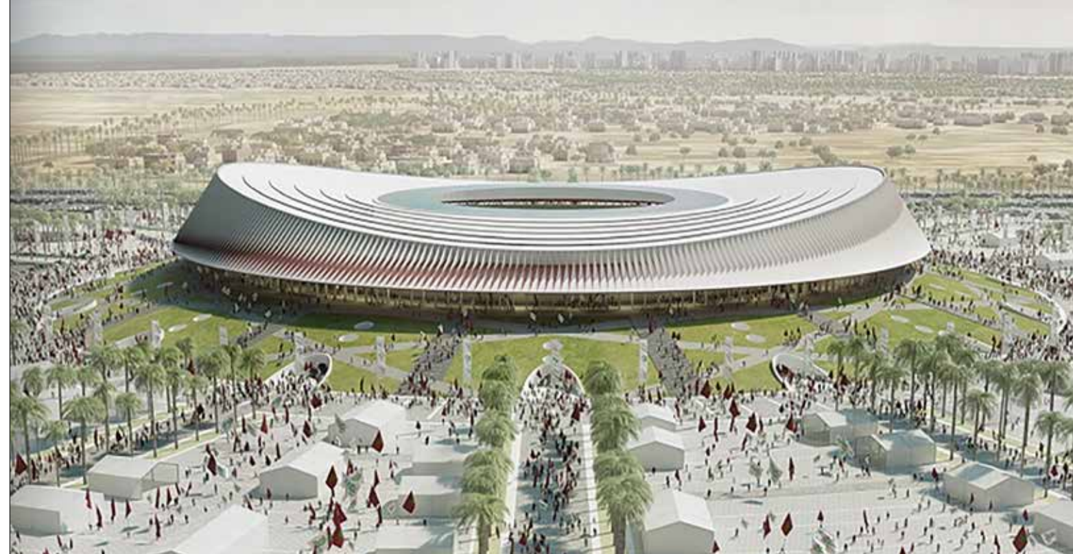
Novo estádio de Casablanca

Com saídas fixas à sexta-feira, esta nova linha chega depois entre segunda e terça-feira. Por outro lado, anunciou a GTS, o serviço permite que os clientes escolham entre o levantamento da mercadoria no Hub do parceiro em Casablanca ou a entrega direta ao destinatário final mediante solicitação. Além disso, a utilização de reboques fechados e rígidos oferece maior segurança durante o transporte. ◀