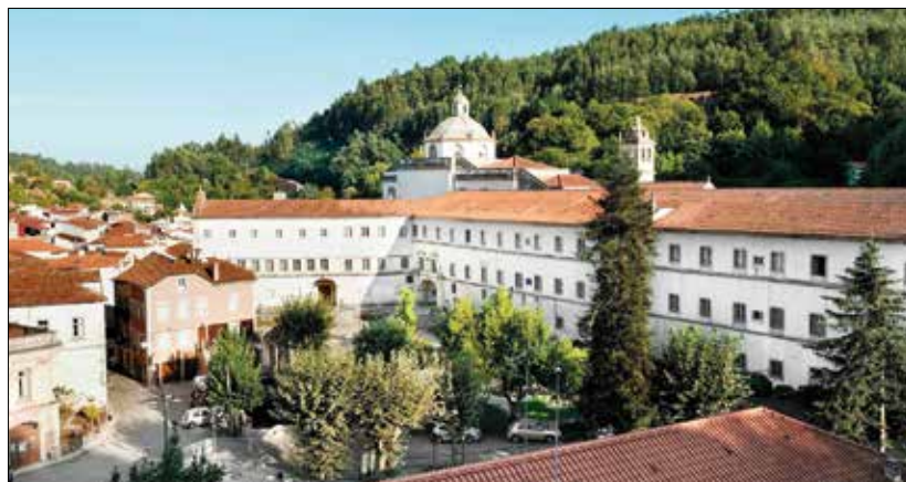
Mosteiro de Lorvão

Como referiu, no concelho de Penacova temos alguns “tesouros” naturais, entre os quais destaco os penhascos conhecidos como “Penedos da Carvoeira”, que podemos observar daqui, bem como a “Livraria do Mondego”.