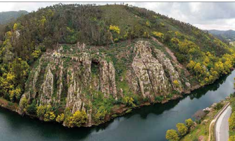
“Livraria do Mondego”, monumento natural de Penacova

O projeto de duplicação do IP3 já foi anunciado há muitos anos, houve até várias declarações, incluindo aqui na região, de diversos responsáveis governativos, e de diferentes governos, de que iria arrancar a obra da modernização do IP3. Mas, até hoje, nunca arrancou. Compreendo a sua pergunta, e não me custa admitir que os responsáveis políticos da região, nomeadamente os autarcas, não tenham sido suficientemente reivindicativos junto do poder central para garantir que essa obra estruturante para o desenvolvimento da região já tivesse sido há muito concretizada.