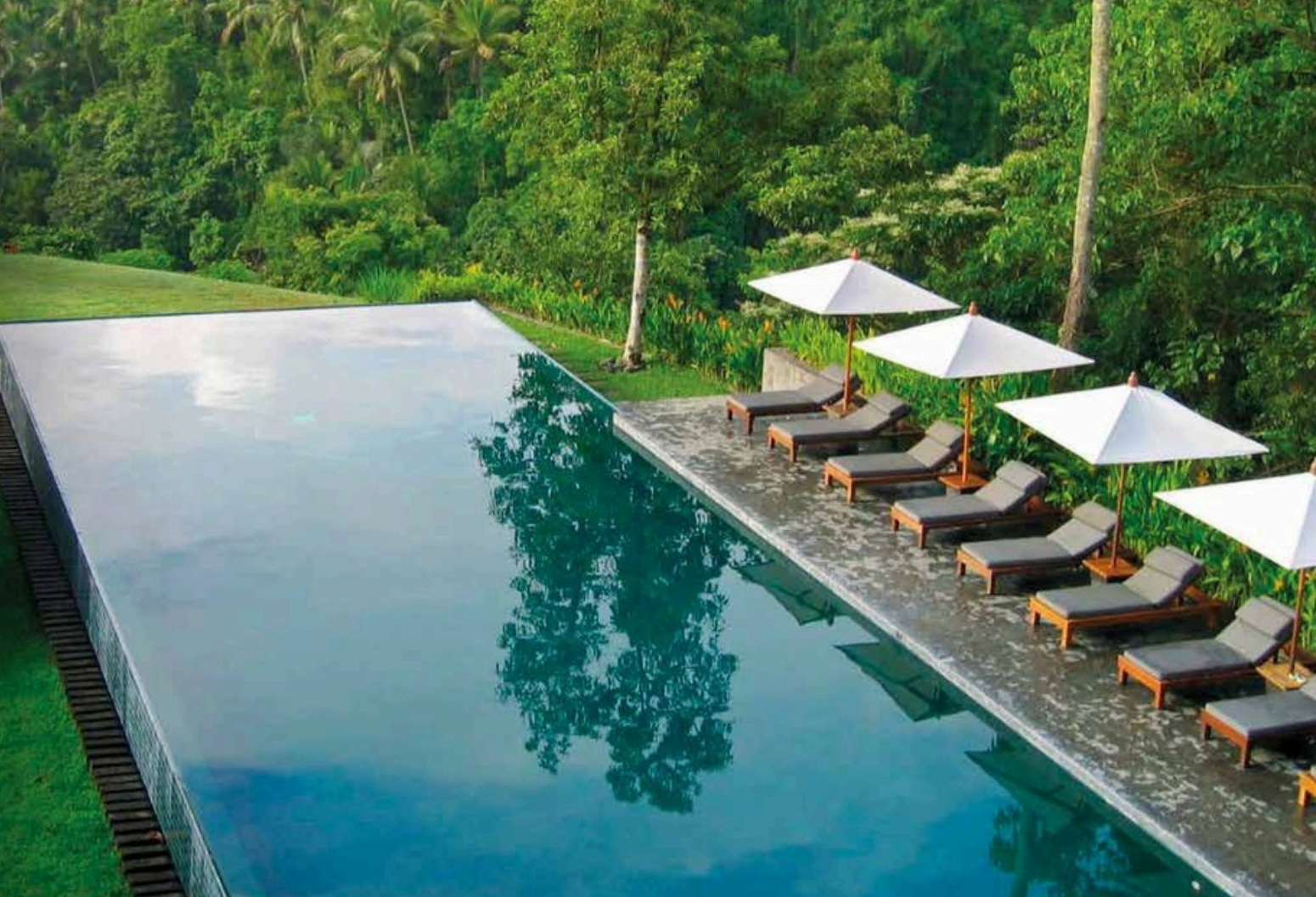
Eco-Resort en Guinée-Bissau